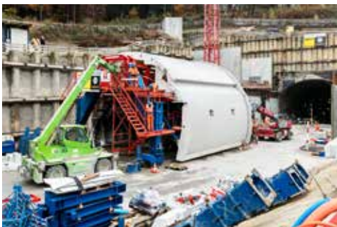
Der mobile Schalwagen für das Tunnelgewölbe

Mit den hierfür erforderlichen Arbeiten startete das ASTRA im Sommer 2016. Die einzelnen, nachfolgend beschriebenen Schritte werden auf unterschiedlichen Abschnitten des Tunnels zum Teil gleichzeitig ausgeführt. Ist ein Arbeitsschritt auf einem Teilstück abgeschlossen, wird er anschliessend auf dem nachfolgenden Abschnitt vollzogen. Dabei arbeiten sich die Tunnelbauer Stück für Stück von der Engi bis ins Bahntal vor.